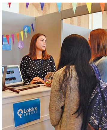
Loisirs Enchères démontre que le prix des loisirs peut être relatif.

« Nous ne sommes pas sur de la dernière minute. Nous sommes partenaires pour leur permettre