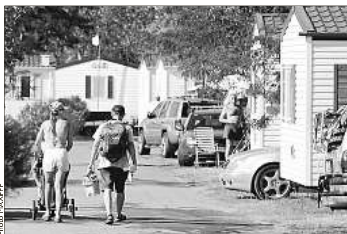
Les campings ont le vent en poupe, comme en attestent les chiffres des réservations.