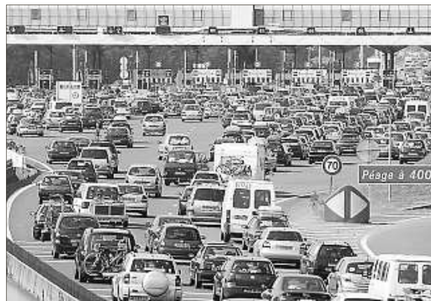
La hausse des prix du carburant risque, cette année, d'avoir un impact important sur les départs en vacances des Français.

Autre phénomène : « Les Français partent moins longtemps mais de plus en plus souvent. » En témoigne la hausse des courts séjours, d'une à trois nuits. Pour payer moins cher, ils se tournent également de plus en plus vers le web. « Les Français ne partent pas plus en vacances avec internet. En revanche, la donne a changé et ils ont de plus en plus tendance à devenir les vrais organisateurs de leurs séjours. Le web permet, par l'accès facilité aux informations et aux comparaisons de toute nature, d'optimiser le budget disponible en recherchant soit le meilleur rapport qualité/prix, soit des offres correspondant au budget prédéterminé. Ainsi, 44 % reconnaissent avoir préparé