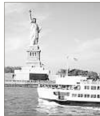
En raison notamment d'un euro dopé face au dollar, le nombre de personnes entrées aux Etats-Unis pour un voyage d'affaires ou d'agrément a augmenté de 15 % au premier trimestre.